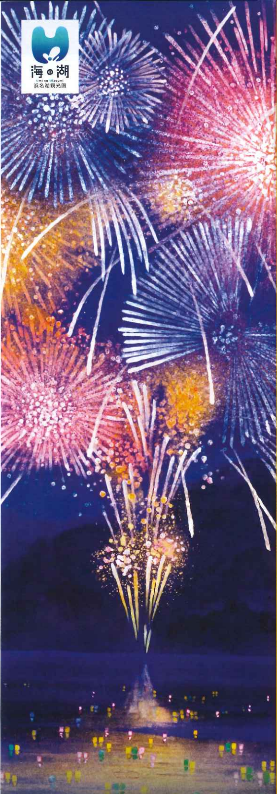
画/栗原幸彦「籠山寺の花火」