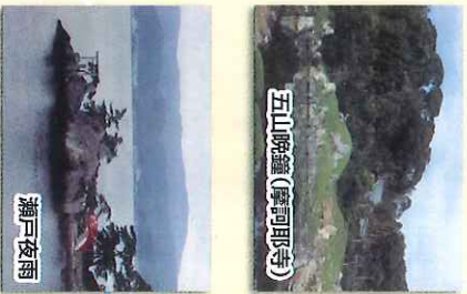
五山晚鐘(摩訶明寺)

※浜名湖遊覧船瀬戸港から浜名湖遊覧船で出発地まで戻る事が出来ます。(乗船代が別途がかかります)