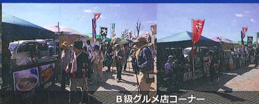
B級グルメ店コーナー