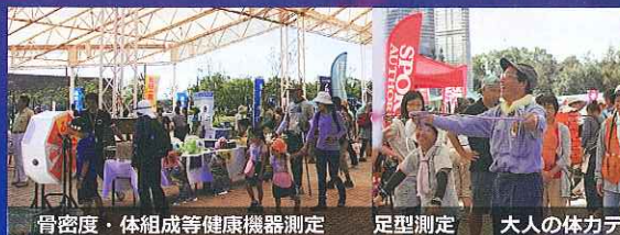
骨密度・体組成等健康機器測定