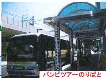
パンビツアーのりばと送迎シャトルバス

※ダイヤ改正にともない、予告なく出発時刻等の時間に変更となる場合がございます。ご利用の際は、予めご確認くださいませ。ご予約は、ご利用のホテルへお願いします。