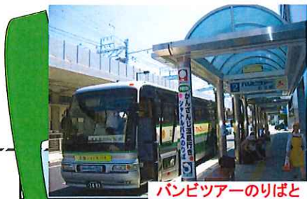
バンビツアーのりばと送迎シャトルバス

※ダイヤの変更にもない、予告なく出発時刻等の時間が変更となる場合がございます。ご利用の際には、予めご確認くださいませ。ご予約は、ご利用のホテルへお願いします。道路の渋滞状況により、到着時間が前後します。ご注意ください。