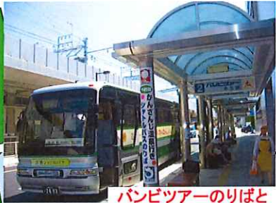
バンビツアーのりばと送迎シャトルバス

※ダイヤ改正にともない、予告なく出発時刻等の時間に変更となる場合がございます。ご利用の際には、予めご確認くださいませ。ご予約は、ご利用のホテルへお願いします。道路の渋滞状況により、到着時間が前後します。ご注意ください。