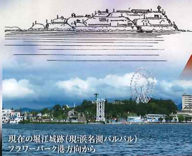
現在の堀江城跡(現:浜名湖パルパル)フラワーパーク港方向から